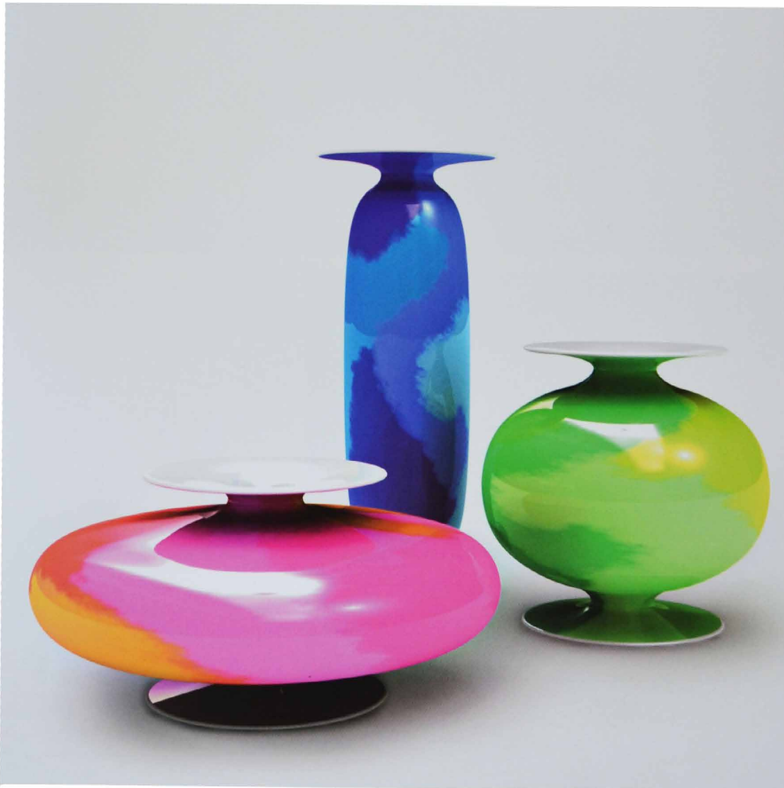
Lullaby Stefano Giovannoni - 2006 La Nuova Fenice con Laboratorio Antonio Trezza