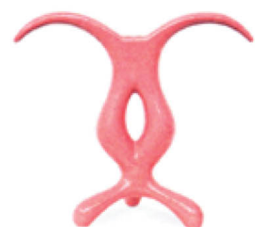
Anna Gili, Cro, vaso / vase, 1984