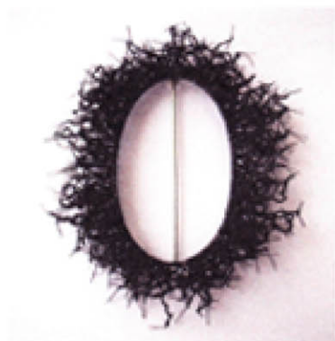
Carla Castiajo, Auto Portrait, spilla / brooch, 2007