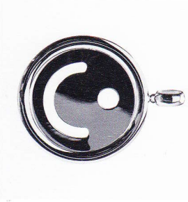
Amulero, 2013 pendente | pendant argento | silver per | for LOS srl