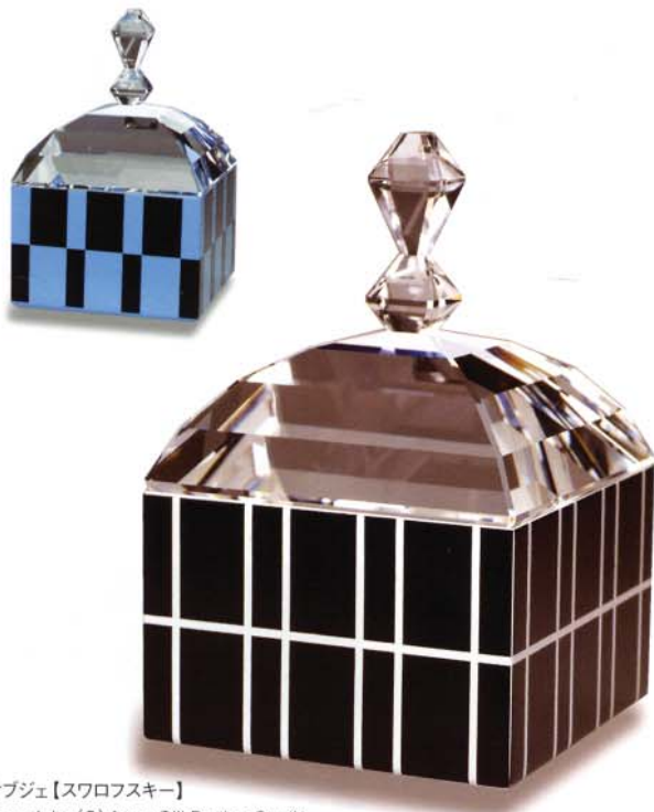
オブジェ【スワロフスキー】 Copyright (C) Anna Gili Design Studio