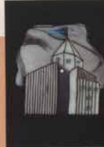
1. Spilla della collezione I Maestri dal Superstudio 2. Spilla della collezione I Maestri, ispirata al Teatro del mondo a Venezia di Aldo Rossi